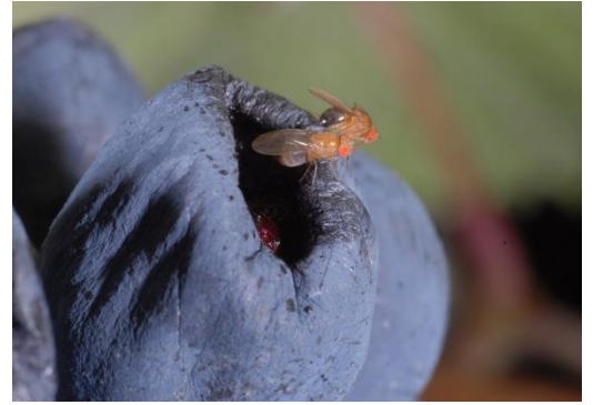
Abb. 1: Vorgeschädigte Beeren werden von Essigfliegen gerne befliegen.