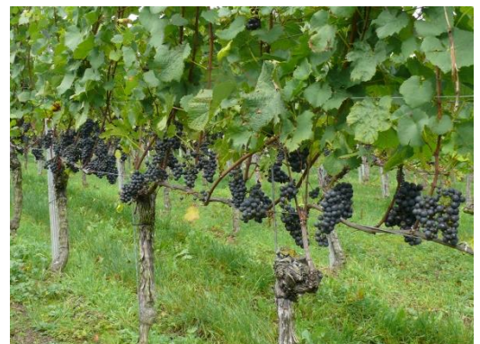
Abb. 3: In einer gut entblätternen und damit luftigen Traubenzone sind nachweislich weniger Kirschessigfliegen zu finden.