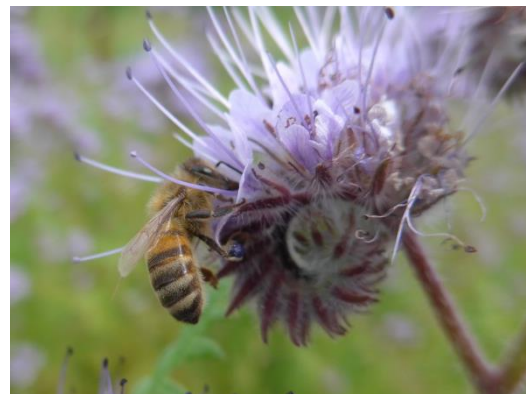
Abb. 6: Bei Bienenflug in der blühenden Begleitvegetation dürfen keine bienengefährlichen Pflanzenschutzmittel eingesetzt werden.

Vorbeugende Behandlungen vor dem Farbumschlag und nach der Ernte sind nutz- und wirkungslos. Nur zugelassene oder genehmigte Produkte dürfen verwendet werden und die Wartezeit ist einzuhalten. Aufgrund von Resistenzgefährdung sollten die Mittel entsprechend einem von der Beratung empfohlenen Resistenzmanagement (Wechsel der Wirkstoffe) eingesetzt werden. Besonders zu beachten ist die Bienengefährlichkeit einzelner Mittel.